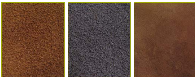
Baby Camurça de cor conhaque

Está autorizada a utilizar o rótulo Biocalce Cuidado Extra, em peles de corte para uso em calçado forrado de acordo com as especificações expressas no boletim de ensaios: CQ-1711/2008 de 2008/11/26, CQ-1713/2008 de 2008/11/26 e CQ-1815/2008 de 2008/12/29 para os seguintes artigos: